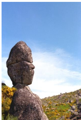
Cabeça do Soldado

Do ponto de vista geomorfológico, a área de maior interesse, na Serra da Gardunha, situa-se próximo de Castelo Velho a uma cota entre 1006 e 1029, onde se podem observar 5 afloramentos graníticos com destaque para o bloco de “Fracturação Poligonal”, o “Bloco Fendido”, os “Blocos Residuais” e alguns “Tor”, considerados de “elevado valor geológico à escala mundial” (ProGEO - Associação Europeia para a Conservação do Património Geológico).