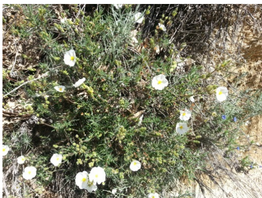
Caldoneira ( Echinopartum ibericum )