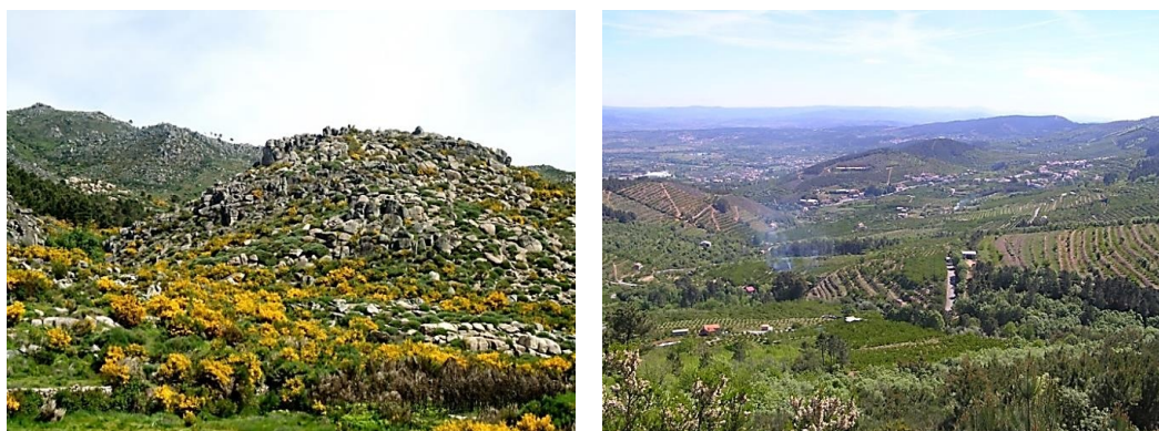
Aspetos da Paisagem Protegida Regional da Serra da Gardunha

Paisagem Protegida Regional da Serra da Gardunha. Diploma de criação. Área. Caracterização.