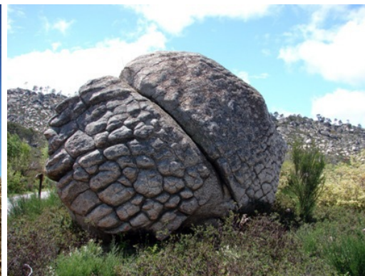
Bola com “Fracturação Poligonal”

Toda esta diversidade constitui um património natural riquíssimo ao qual está associado um valor inestimável representativo de uma herança e identidade que importa gerir e preservar meticulosamente de modo a poder transmiti-la às gerações futuras.