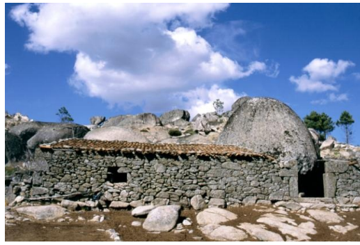
Curral, Castelo Velho

A paisagem da serra revela uma forte componente de intervenção humana ao nível das áreas agrícolas, com especial destaque para os cerejais e áreas florestais de resinosas. No entanto, mantêm-se áreas ocupadas por formações naturais e seminaturais detentoras de uma significativa e valiosa diversidade biológica.