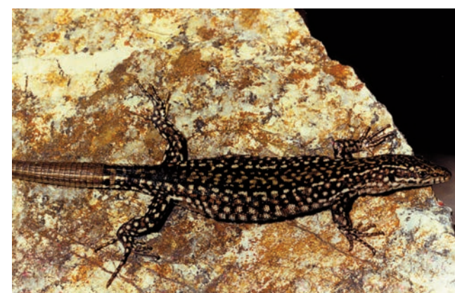
Serra da Estrela, Morfotipo 1