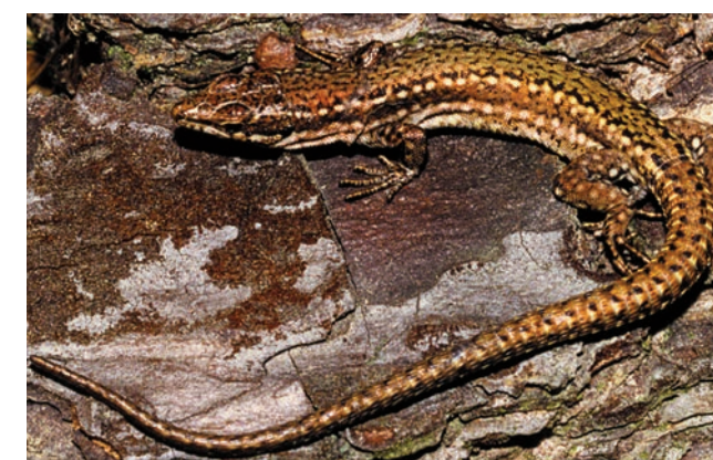
Coimbra, Morfotipo 2