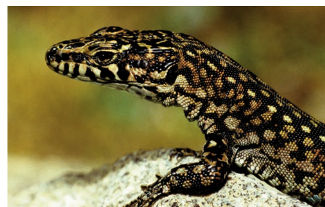
Serra da Estrela, Morfotipo 1