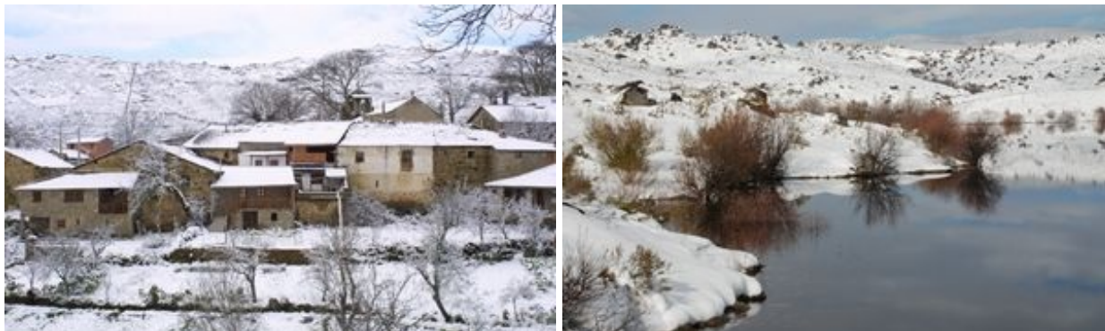
Aldeia de Montesinho e barragem da serra Serrada.

Parque Natural de Montesinho (PNM). PR 3 - Porto Furado. Percurso pedestre com cerca de 8 km. Breve descrição. Mapa. Folheto.