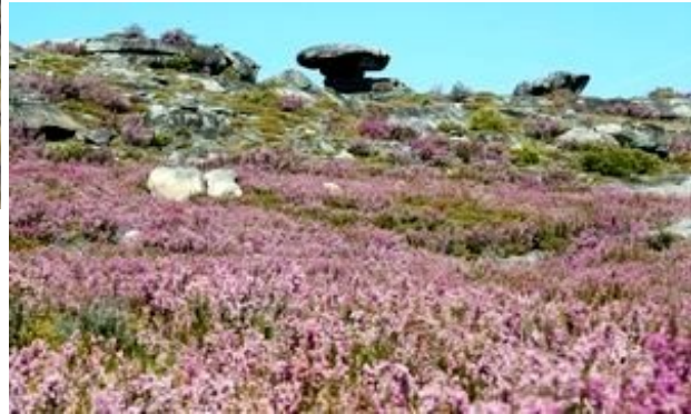
Paisagem na serra de Montesinho e urzal em flor.

Este percurso circular, com cerca de 8 km, entrelaça-se com pequenos cursos de água que escorrem do alto da serra, indo engrossar a ribeira das Andorinhas, afluente do Sabor. A paisagem é profundamente marcada pelos afloramentos graníticos de formas arredondadas, emergindo por entre um coberto vegetal dominado por matos (urze Erica spp., carqueja Pterospartum tridentatum ssp. tridentatum , charguaço Helianthemum umbellatum ), manchas de carvalho-negral Quercus pyrenaica e por lameiros que ocupam as zonas ribeirinhas.